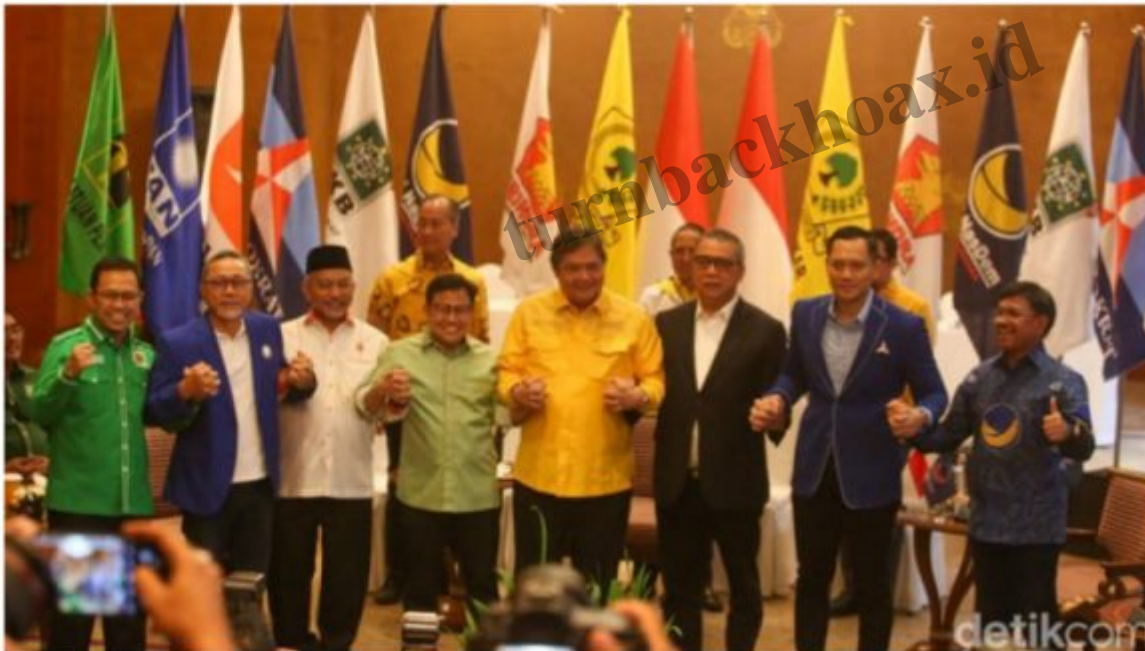
7 pimpinan partai politik dalam pertemuan kesepakatan menolak pemilu coblos partai

Jakarta - Partai-partai di parlemen kecuali PDIP telah menggelar