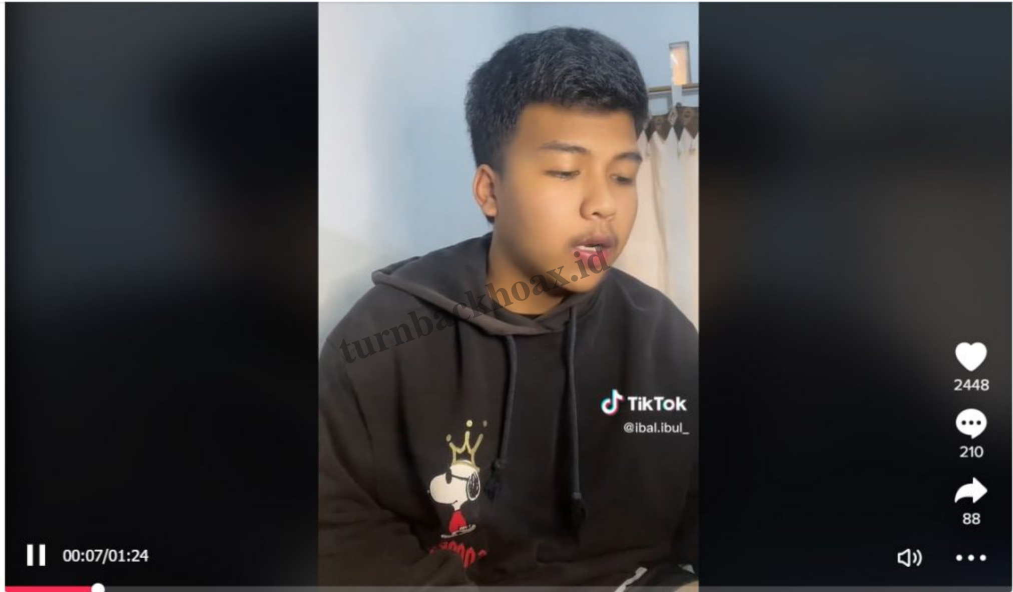
Solo damai men temen 🙏 #solo24jam #surakarta