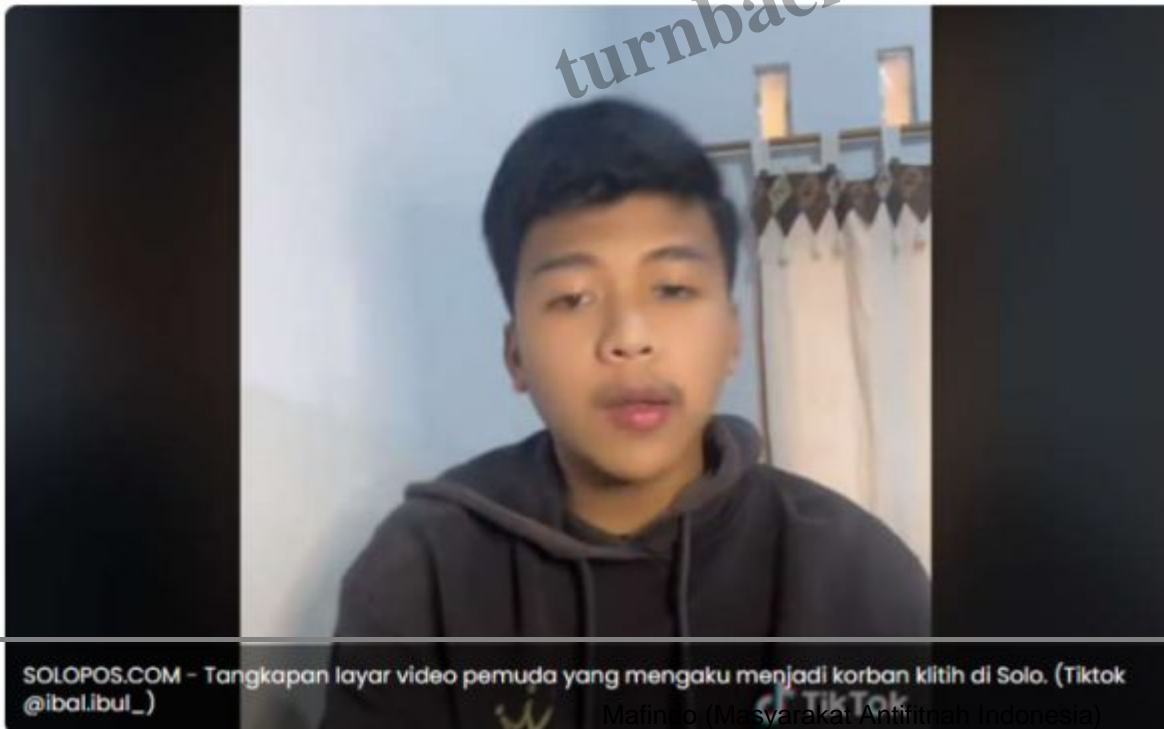
Tangkapan layar video pemuda yang mengaku menjadi korban klitih di Solo.