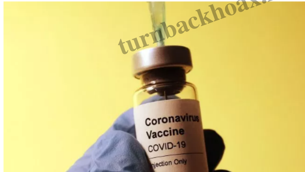
Ilustrasi vaksin Covid-19

Suara.com - Ada sejumlah kekhawatiran efek samping di balik program vaksinasi Covid-19 yang tengah berjalan di banyak negara di dunia. Salah satunya ialah khawatir bahwa vaksin Covid-19 akan menurunkan jumlah dan kualitas sperma .